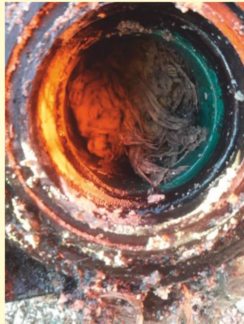
Pumpenverstopfung durch feuchte Toilettentücher

Wer all diese Einleitungsverbote nicht beachtet, haftet der Gemeinde für ihr dadurch entstandene Schäden und Nachteile. Ferner handelt es sich um eine Ordnungswidrigkeit, die mit Geldbuße belegt werden kann. Im Namen der Mitarbeiter des Langenaltheimer und Treuchtlinger Bauhofes sowie der Treuchtlinger Kläranlage dürfen wir uns für Ihre Unterstützung bedanken. Für weitere Fragen stehen wir gerne zur Verfügung.